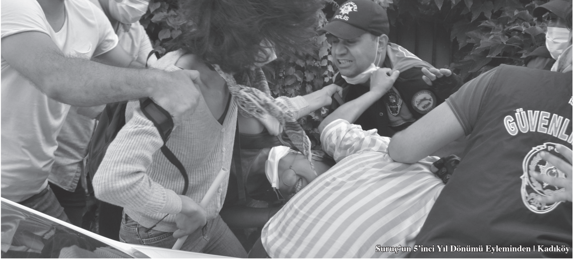
Suruç'un 5'inci Yıl Dönümü Eyleminden | Kadıköy

Faşist saldırganlık olduğu müddetçe, ona karşı mücadele edenler mutlaka olacaktır. Önemli olan bu mücadeleyi başta işçi sınıfı olmak üzere kadınların, gençlerin, Kürt ulusunun, Alevilerin kısacası bütün Türkiye halkının demokrasi, özgürlük ve devrim mücadelesiyle birleştirebilmektedir.